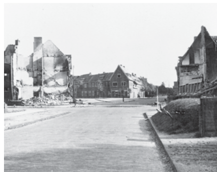
De verwoesting van de hoek Groesbeeksedwarsweg - van Heutzstraat.

De historicus Joost Rosendaal beschrijft in zijn boek Nijmegen '44. Verwoesting, verdriet en verwerking (2009) wat het bombardement op Nijmegen aanrichtte: "Met riviertorpedo's en luchtbombardementen trachtten de Duitsers tevergeefs de bruggen te vernietigen. Ook de stad werd hierbij onder vuur genomen. In de nacht van 28 op 29 september (1944) deden twaalf Duitse zwemmers, van wie er één aan de Olympische Spelen in Berlijn had meegedaan, een poging de bruggen met springstof op te blazen. De spoorbrug liep deze nacht zware schade op en werd onbruikbaar doordat het middenstuk eruit geblazen was. In het wegdek van de verkeersbrug werd een gat geslagen, maar verder bleef