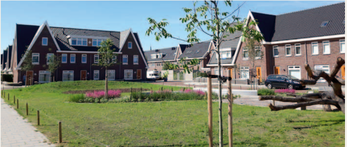
Het Spieghelhof waar de herdenkingsmuur komt

Op woensdag 28 september wordt het monument op de Spieghelhof symbolisch ingewijd door de onthulling van de plaquette bij de herdenkingsmuur. De Wijkraad Willemskwartier ( www.willemskwartiernijmegen.nl ) nodigt de bewoners van het Willemskwartier van harte uit om deze gelegenheid bij te wonen.