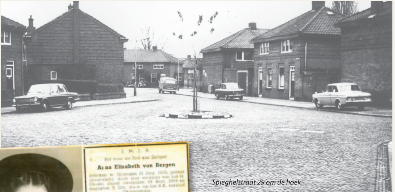
Spiegelstraat 29 om de hoek