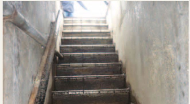
De schuilkelder aan de Kop van de Willemsweg