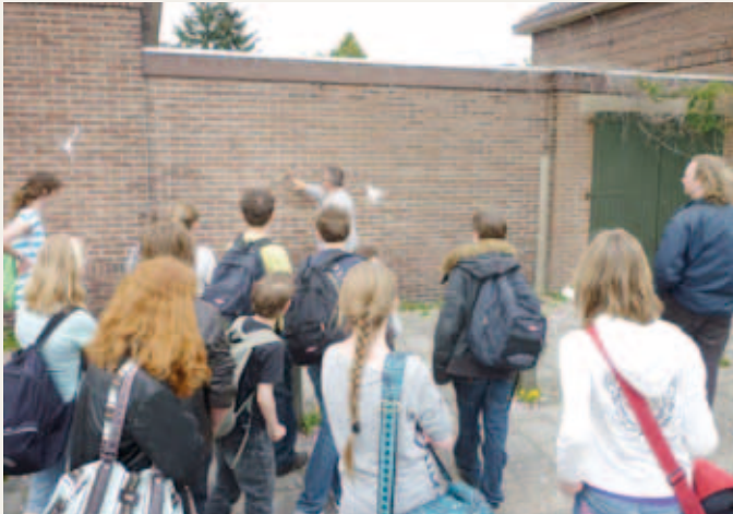
Bezoekers van de schuilkelderderoute kijken naar de muur die 28 september symbolisch wordt ingehuldigd als oorlogsmonument