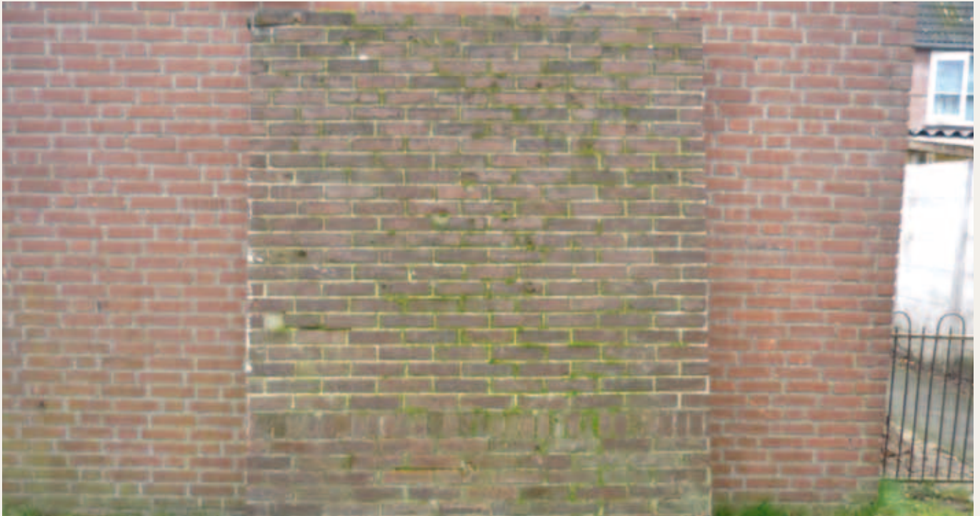
De muur die 28 september wordt ingewijd als oorlogsmonument, leunend tegen de blinde muur van voormalig buurthuis De Vrijbouter

Maar in de plek waar de stedenbouwkundige de muur uiteindelijk had getekend, konden de omwonenden zich wel vinden: met de 'goeie' kant richting het zuiden, ongeveer in het midden van het parkje te midden van bomen en struiken in een 'eigen' ovaal grondvlak.